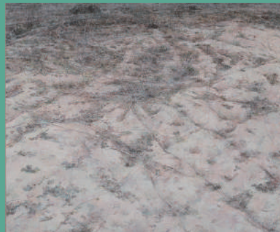
長原歟 (site. N) 総社市蔵 第7回雪舟の里総社墨彩画公募展 雪舟大賞