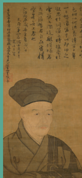
【パネル紹介】 模写者不明 重文 雪舟自画像