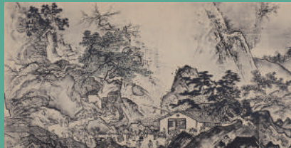
【複製】雪舟等楊《四季山水図巻》(山水長巻)部分、(公財) 総社市文化振興財団蔵

雪舟は、後世の画家にも大きな影響を与えました。今回、湯浅コレクションより雪舟関連作品6点を展示予定です。